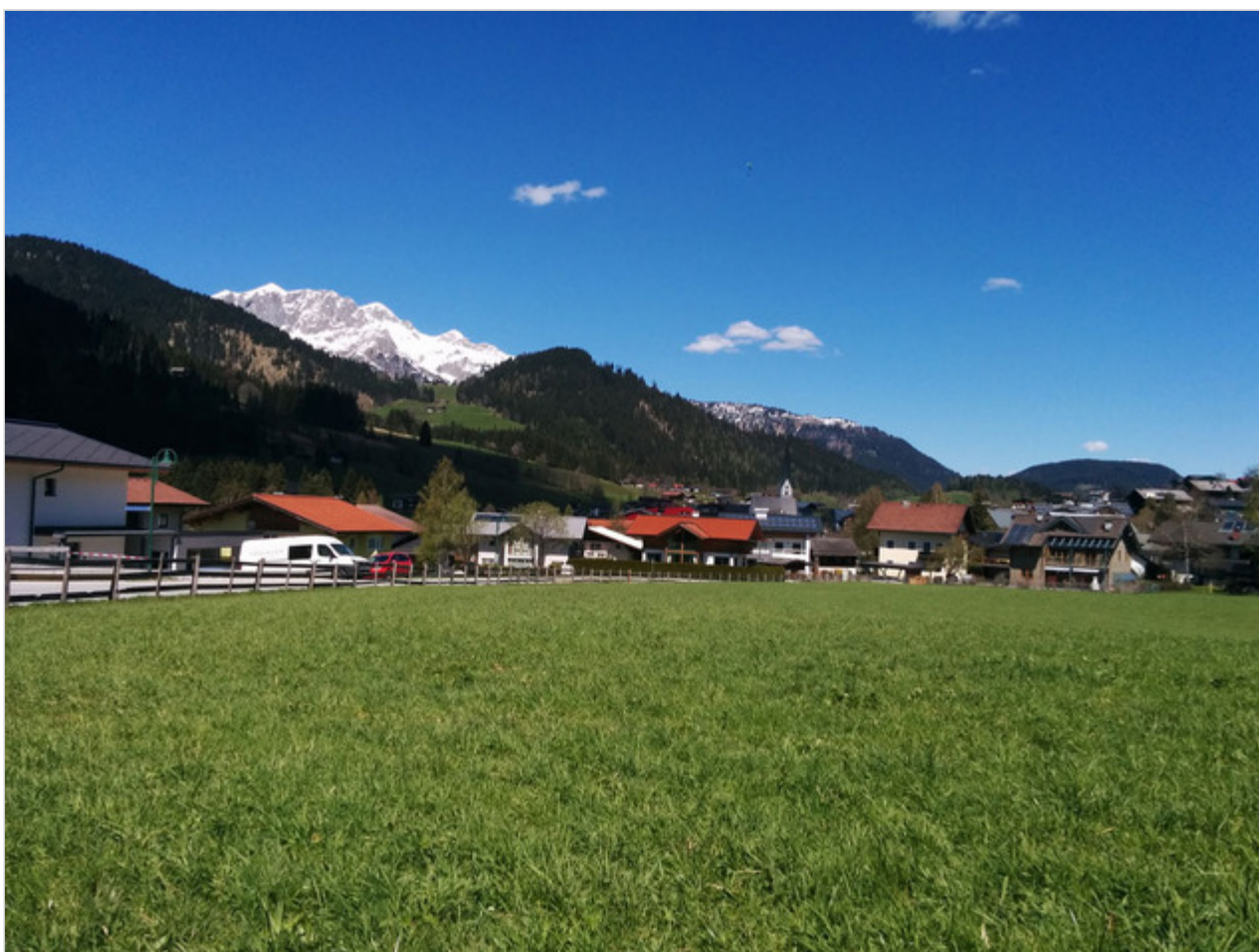
הכפר סנט מרטין

הצצנו לחיים אחרים של ילדים אחרים, כאלה שלא רק שונים מהילדים שלנו, הישראליים, אלא כנראה שונים גם מאלה שחיים בערים הגדולות באוסטריה. הלכנו אחריהם, עיתונאים מישראל שהגיעו לסיור בחבל זלצבורג, וצילמנו בהרגשה שגילינו שבת בג'ונגל שראוי לתעדו, שחשפנו סגנון חיים שהשתמר מאות שנים. ילדים מסורתיים.