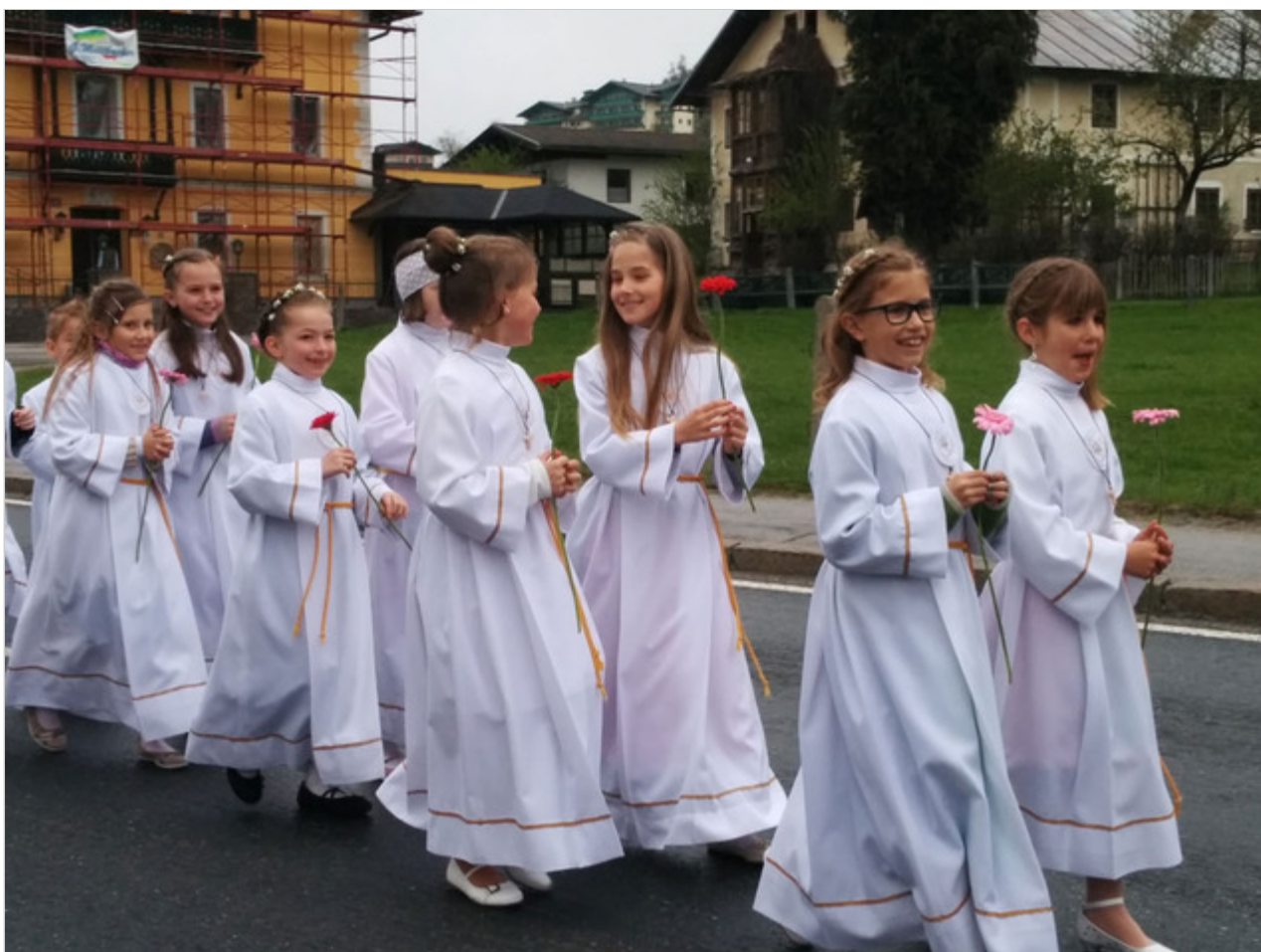
מסורת של אלפי שנים

זה לא נדיר בסנט מרטין ובכפרים הסמוכים לו שבחבל זלצבורג. ביקרנו בבית מלון מהמאה ה-16 ששייך לאותה משפחה, ובכל דור ודור קם ילד שהיה מוכן לשאת בנטל ולהוסיף עוד חוליה לשרשרת המשפחתית שמרכיבה את הכפר הזה ודומיו. וזה מרשים. ושונה ממה שאנחנו מכירים בישראל.