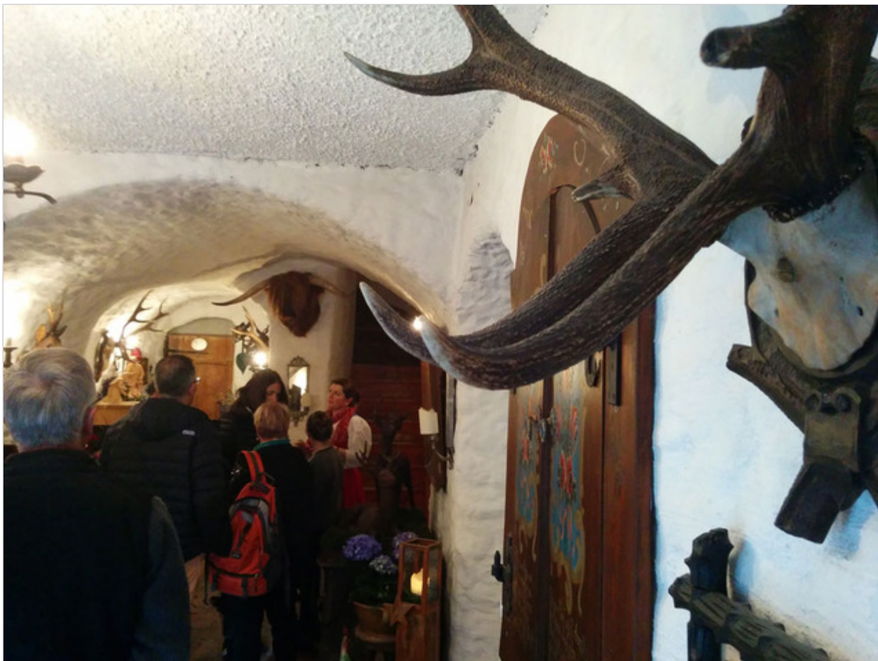
הבית הזה כאן הוא מאז וכנראה לתמיד

אפשר לשער שבוינה, זלצבורג וביתר הערים יש מוביליות חברתית גדולה יותר וצעירים מפלסים דרך שונה מזו של הוריהם, אבל יפה לראות שיש עדיין מקומות שבהן הביטוי "מאב לבנו" עדיין מוחשי, ומגיע בצורת ילדים לבושים לבן בפתח של כנסייה ישנה כחלק מטקס עתיק.