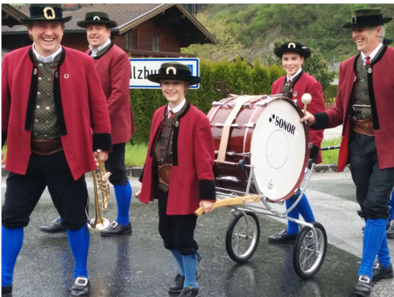
לא, זה לא נראה להם מגוחך

אז לא הופתענו כשראינו ילדים אוסטרים יושבים בדממה, אוכלים בסכין ומזלג, לא רצים, לא משתוללים, לא צועקים, לא בוכים, לא רוטנים, לא מתלוננים. רק לועסים. וכנראה שגם נהנים. נדמה לי שהפרעות קשב, ריכוז והיפראקטיביות הן בכלל לא בעיה ביולוגית אלא תרבותית.