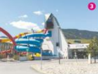
כפר הנופש בסנט מרטינס. 2. מצודת הוהנולפן. 3. פארק המים המקומי. 4. הנוף מהטירה בלצבורג. 5. הנושבים המקומיים בסנט מרטינס