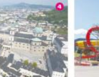
פארק המים המקומי. 4. הנוף מהטירה בלצבורג. 5. הנושבים המקומיים בסנט מרטינס