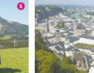
הנוף מהטירה בלצבורג. 5. הנושבים המקומיים בסנט מרטינס

הרעיון בחפשה מסוג זה רווק מאוד מחפשה הכל כולו: כאן תקבלו דירה ביתית ומטאורות