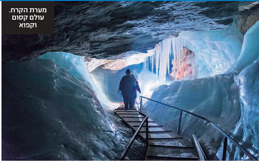
מערת הקרח. עולם קסום וקבוא