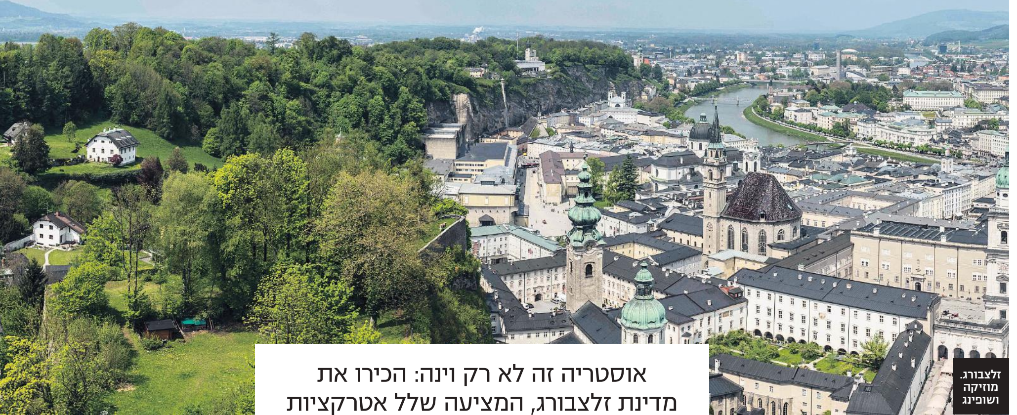
זלצבורג, מוזיקה ושופינג