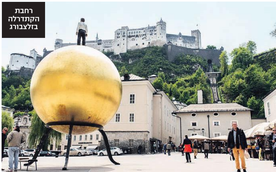
רחבת הקתדרלה בלצבורג